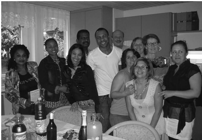
Les participant-e-s au cours EMS à Renens