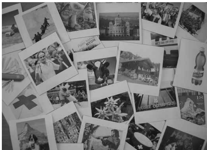
La Suisse en jeu ...